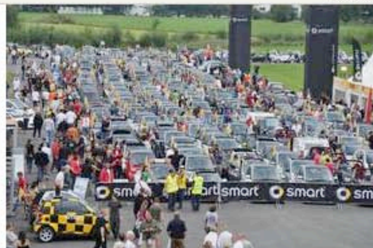
Kategorie: GESAMTKOMMUNIKATION Agentur: lautstark MK Marketing Auftraggeber: Mercedes Benz Österreich Vertriebsgesellschaft Projekt: "smart times 08"