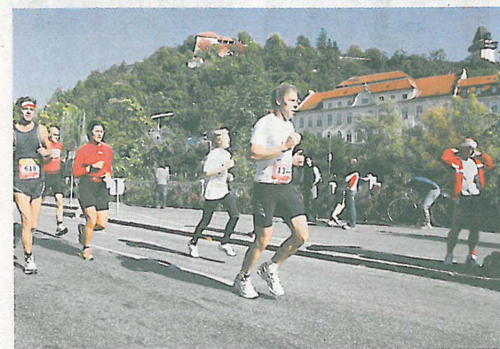
Lauffieber unter dem Uhrturm auch beim Graz-Marathon 2007