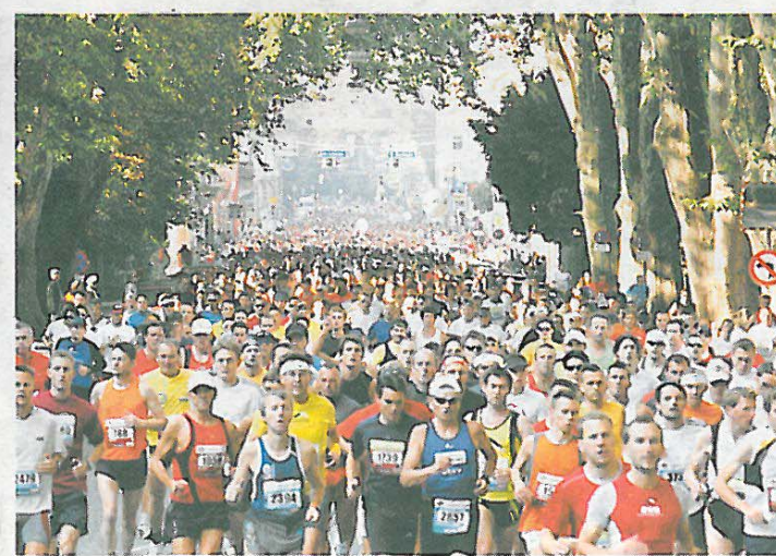
In der Elisabethstraße drängten sich die Läufer-Massen